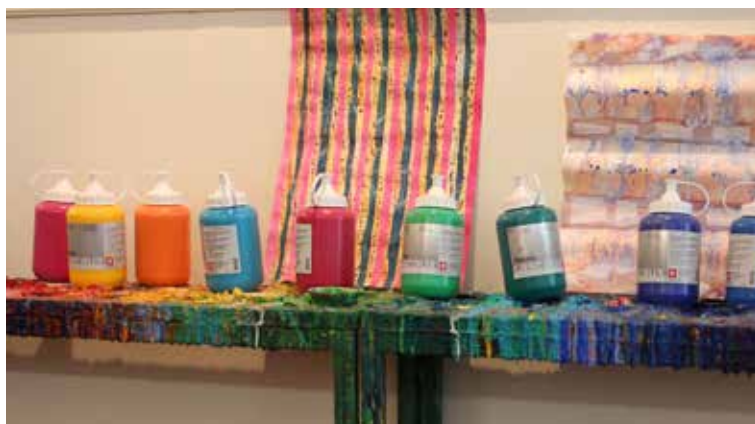
Das volle Programm. Die Farbpalette ist sehr vielfältig.

Alain Friesewinkel Atelier-Werkstatt Riehenring 143 4058 Basel Telefon 079 636 27 09 info@mags-bs.ch www.mags-bs.ch